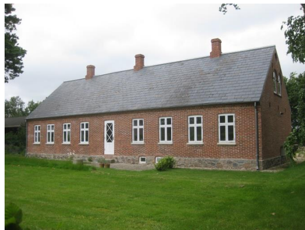
Et nyrenoveret stuehus i bymidten

På Vinkelvej findes et nyere velplejet parcelhuskvarter. Og mod syd er der et område med store parceller – hobbylandbrug, hvor der er gode muligheder for at holde dyr - blandt andet heste – en mulighed som flere benytter sig af.