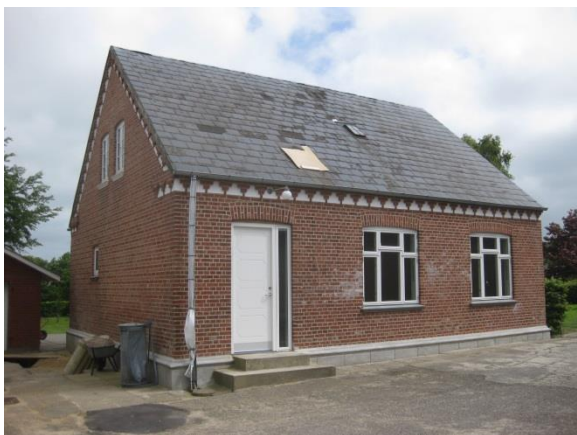
Et fint lille landsbyhus under renovering.

I Bølling er der mange unge familier som har udnyttet muligheden for en relativ billig bolig nær Skjern. Mange af husene er fine gamle landsbyhuse, med originale arkitektoniske kvaliteter.