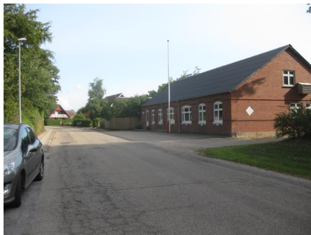
Forsamlingshusets plads flyder sammen med vejen.

Man kan overveje at flytte vejen et par meter over mod idrætspladsen i en bue og på den måde skabe et torv foran forsamlingshuset, og yderligere dæmpe trafikken.