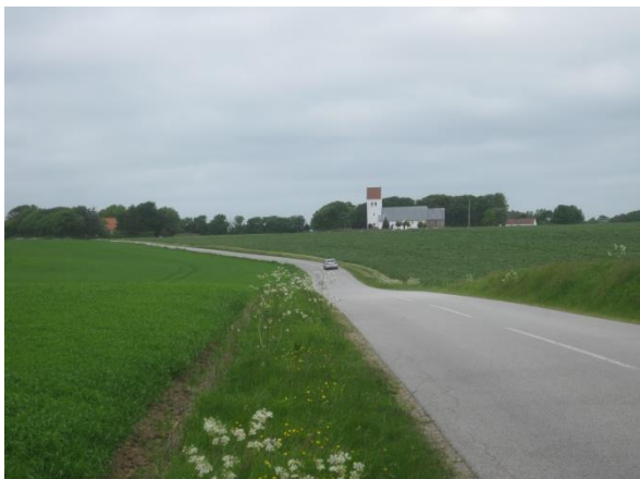
Kirken ligger og byder velkommen når man kommer sydfra

Nærmer man sig Bølling fra syd, får man et usædvanligt smukt udsyn til kirken, som rejser sig på toppen af bakken.