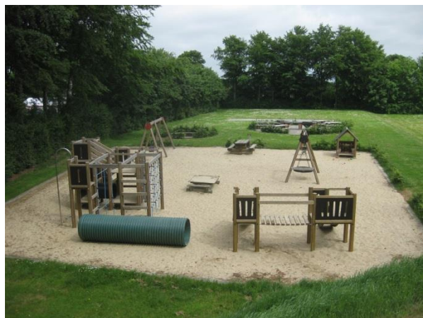
Den nyrenoverede legeplads på stadion

Midt i byen ligger stadion – landsbyens grønne hjerte. Her er der en grillplads og en