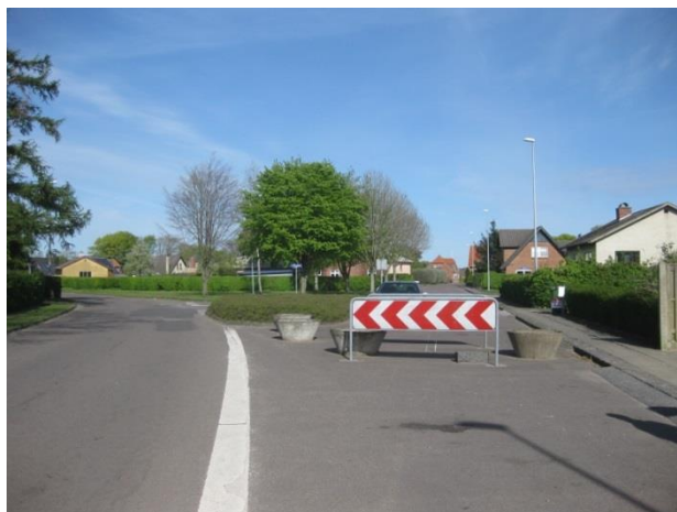
En ikke alt for charmerede indkørsel til byen skal ændres

Afmærkningsskiltet fjernes og i stedet anlægges et større bed af bøgepur der skal nå en højde af 1,2 meter. I bedet plantes tre højere træer for at synliggøre bedet når man kommer vestfra og bryde den flade overside.